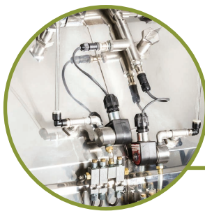
DISTRIBUTEUR ANTI- MOUSSE