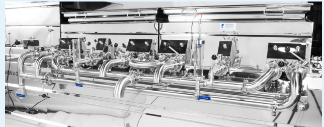
Inverseur de coulée avec sortie centrale